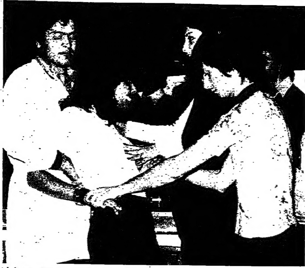
تكثيف يدي طالبة، بعد كم نهائي نطاق البرنامج

الاداب في الجامعة اللبنانية: «انا لم انا شاهدت «المهوية»، ولكنني قرأت عنها في الصحف، واقول بانني ضد كل خفة تخرج من اطار ثقافتنا العربية